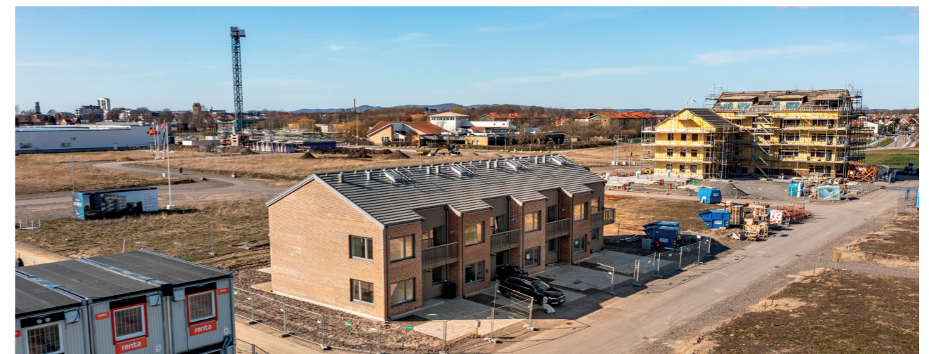
Nybyggnationen på Tornlyckan hjälper till att stärka den ekonomiska situationen.