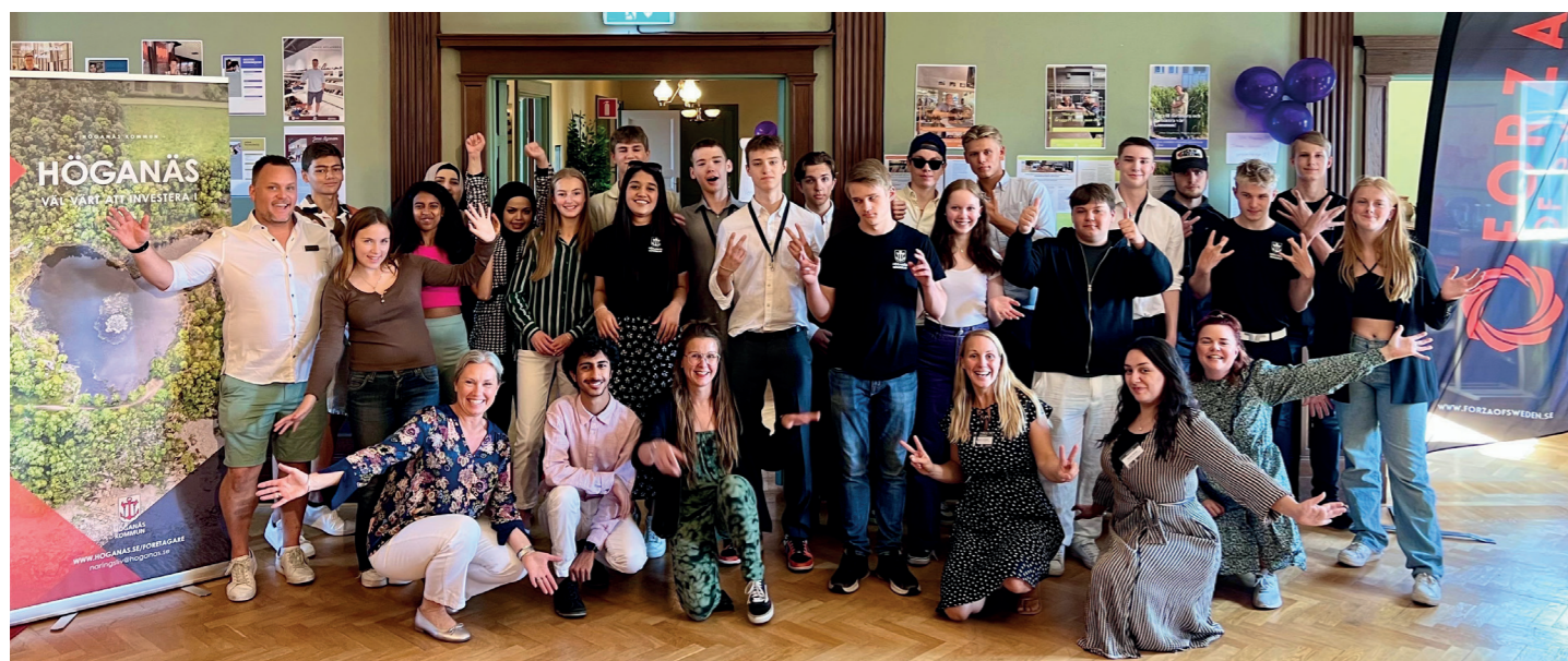
Under tre sommarveckor får ungdomar i Höganäs kommun möjligheten att delta på Forza Summer Höganäs som en del av de kommunala sommarjobben. Deltagarna får testa på livet som entreprenör och utvecklar sitt självledarskap.

Samverkan mellan näringslivsavdelningen/arbetsmarknadsenheten och utbildningsförvaltningen skapar förutsättningarna att arbeta framgångsrikt med olika insatser riktade mot samtliga utbildningsnivåer, från grundskolan till vuxenutbildning. Ett exempel är Sommarlovsentreprenörerna som är en del av kommunens feriejobb och riktar sig till elever från årskurs 9 till 2:an på gymnasiet. Under tre veckor får de en utbildning i entreprenörskap och självledarskap. Totalt av våra ca 220 feriejobbsplatser utgörs 30 platser av denna inriktning och det är ett mycket populärt sommarjobb hos ungdomarna i Höganäs kommun. Andra insatser vi arbetar med är Ung Ekonomi, Smart Matte, Work Walk, Framtidsskoll, Ung Företagsamhet, Business Friday, Mentorsprogram och Kullanästet Innovation och Kullanästet UF.