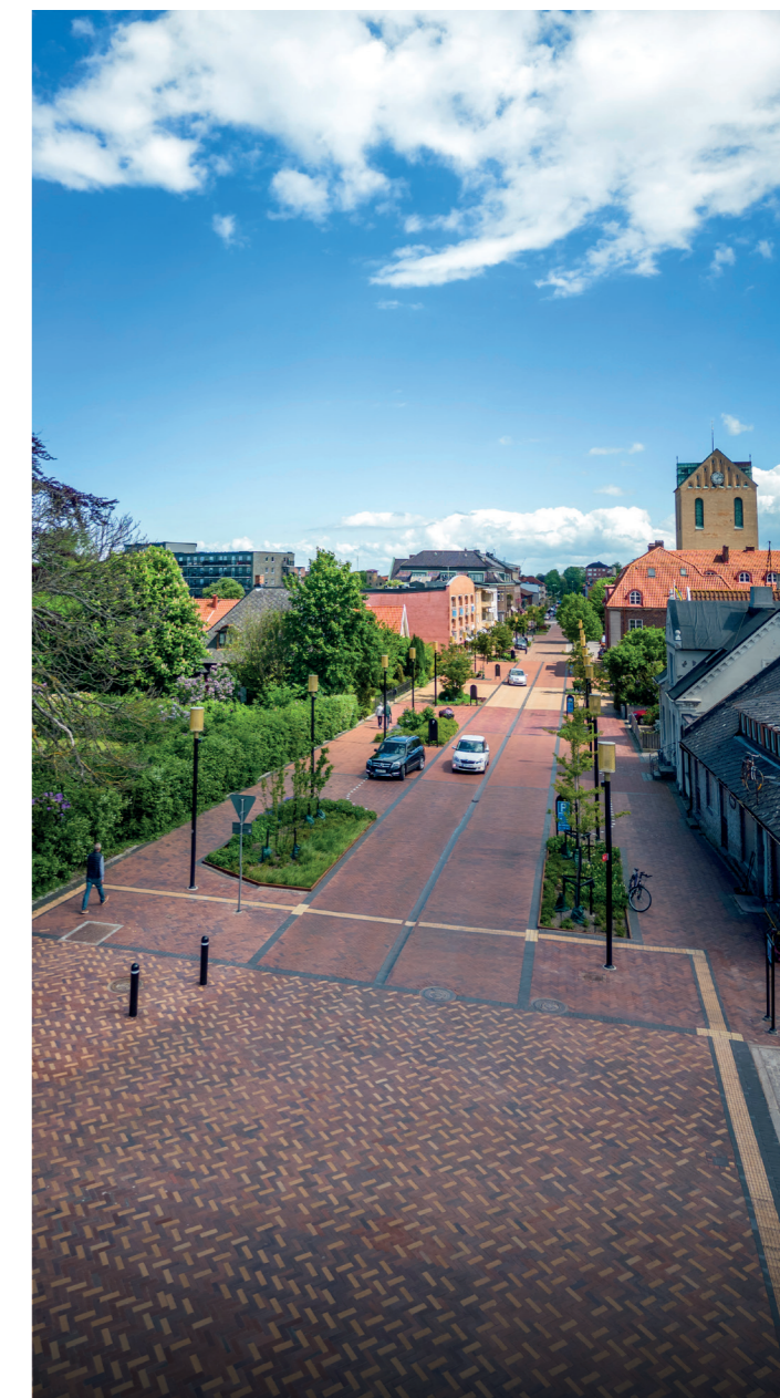
Höganäs har ansökt om att bli årets stadskärna.