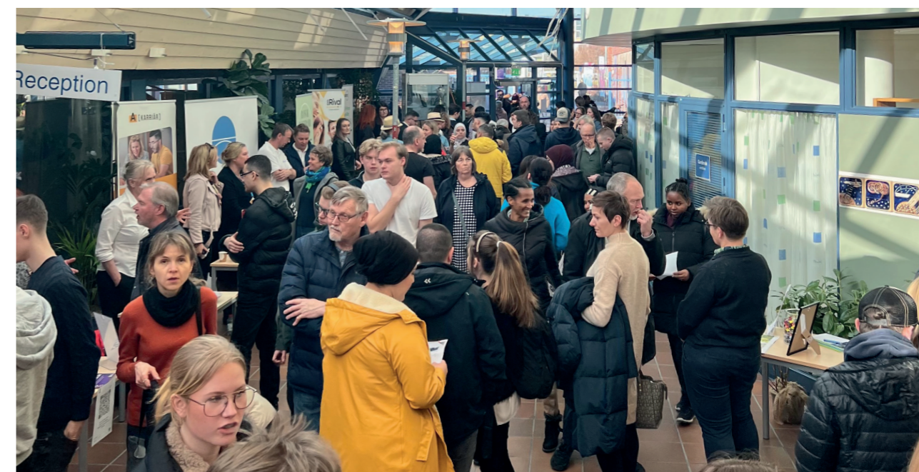
Jobbmässan på Kullagymnasiet blev succé med 800 besökare och 51 utställare.