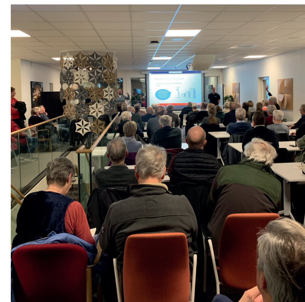
Teknikintresset är stort och närmare 90 personer kom på på Höganäs Energis informationskväll om batterier den 31 januari.