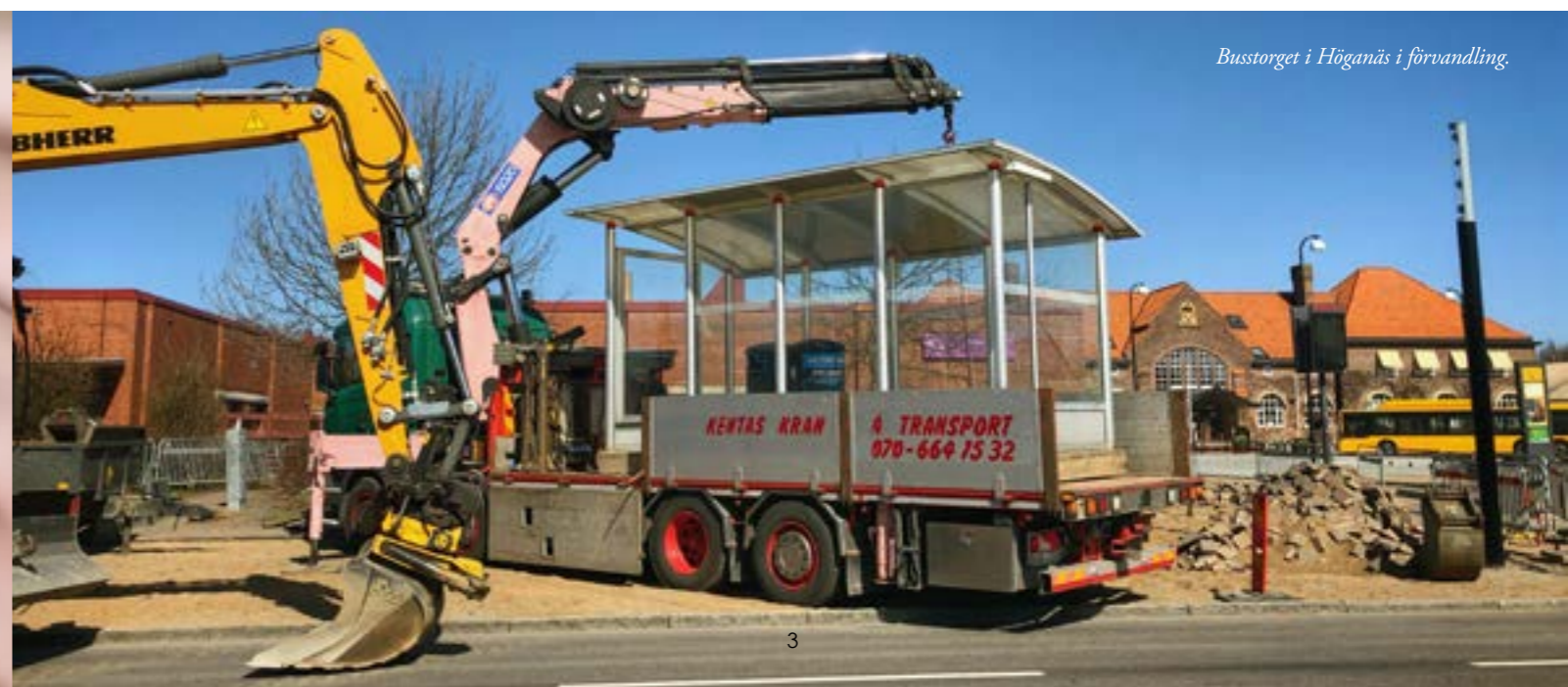
Busstorget i Höganäs i förvandling.