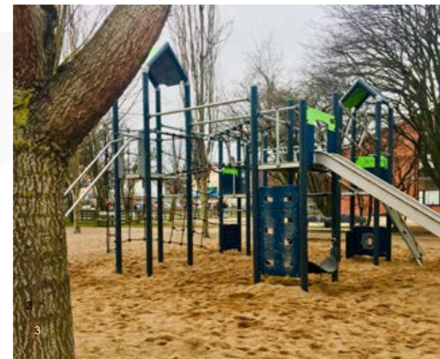
Bruksskolans nya lekturströning.

Plastpåsar i papperskorgarna har tagits bort i ett pilotprojekt som pågår i byggnaderna Stationshuset och Delfinen.