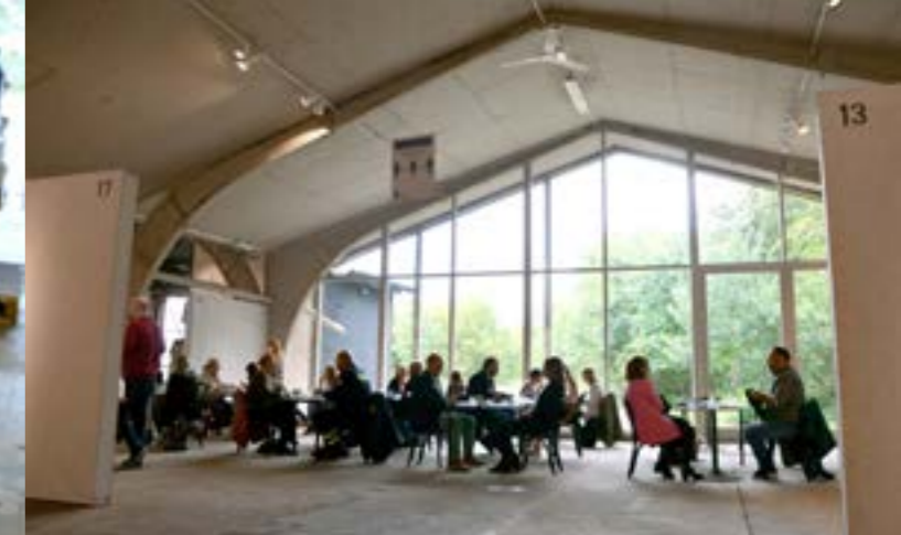
Avslutningen av ledarprogrammet ägde rum i Blå hallen där alla chefer som deltagit i programmet fick ta emot ett diplom.