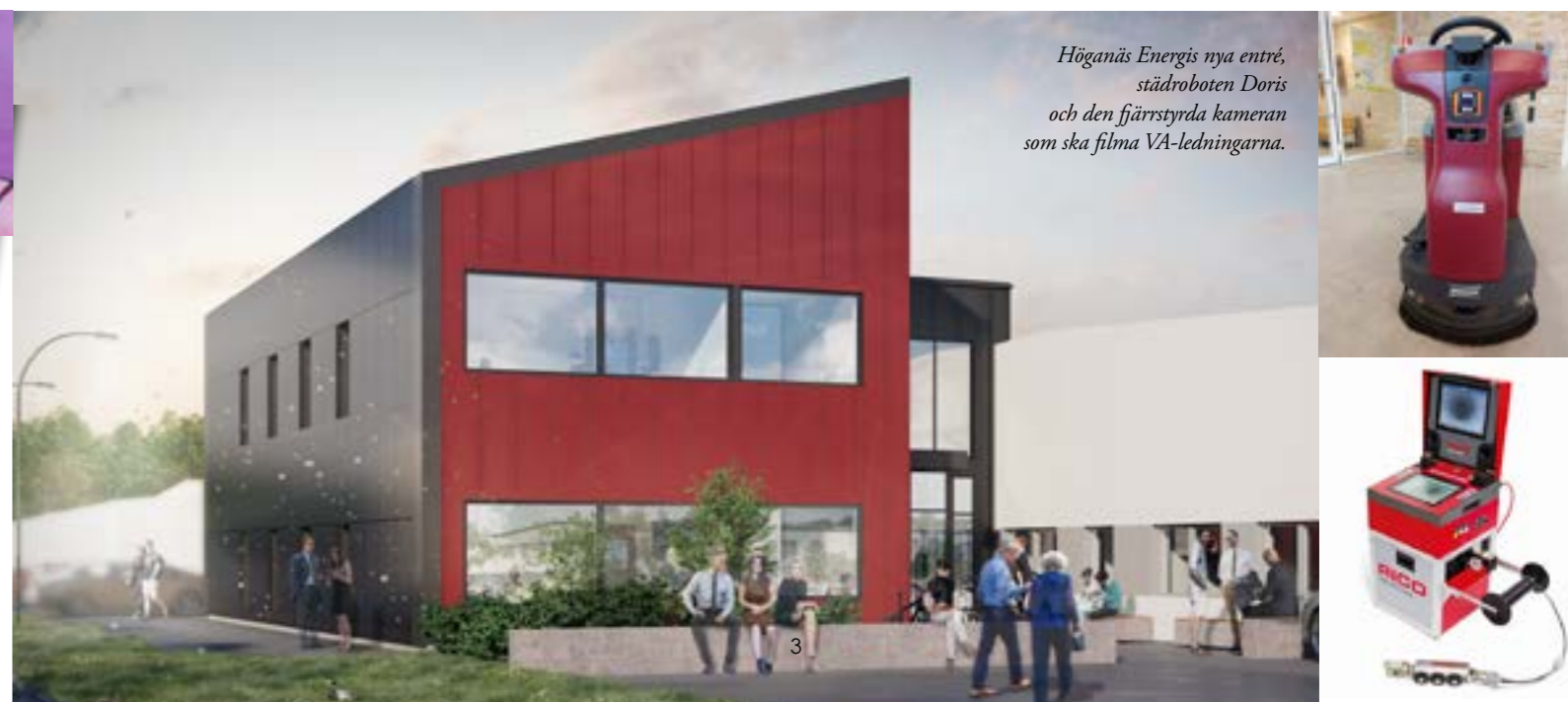
Höganäs Energis nya entré, städroboten Doris och den fjärrstyrda kameran som ska filma VA-ledningarna.