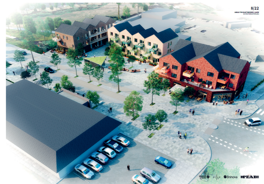
Vikens framtida trygghetsboende. PEABs vinnande gestaltningsförslag som ska byggas av Granitor.