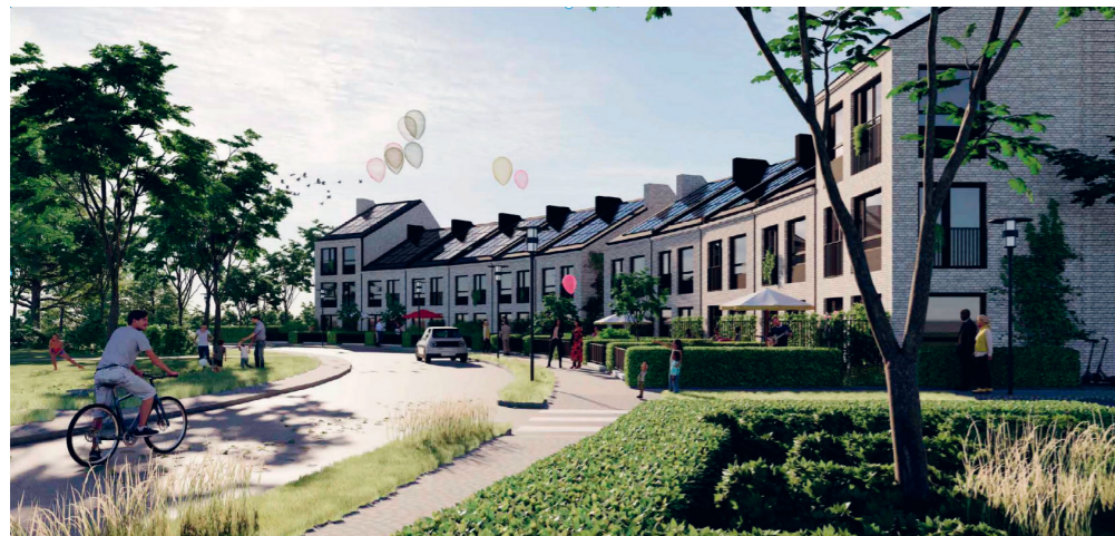
Kvarteret Himlavalvet på Tornlyckan.

På Östra Lerberget pågår planarbetet och Kommunen tillsammans med Derome planerar för ett hundratals bostäder. En del av dessa ska in i den kommunala bostadskön. Detaljplanen väntas antas under 2024.