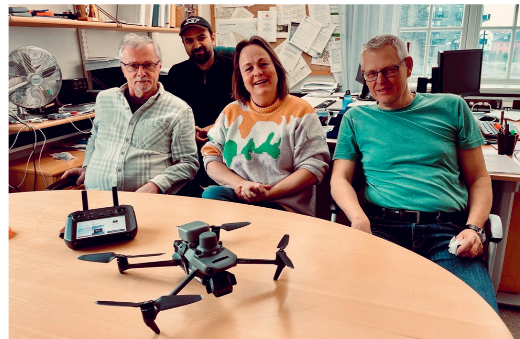
Här ser vi Mätgänget med den nya drönaren som är en Mavic Pro 3M eller "Marvin" som den numera heter.