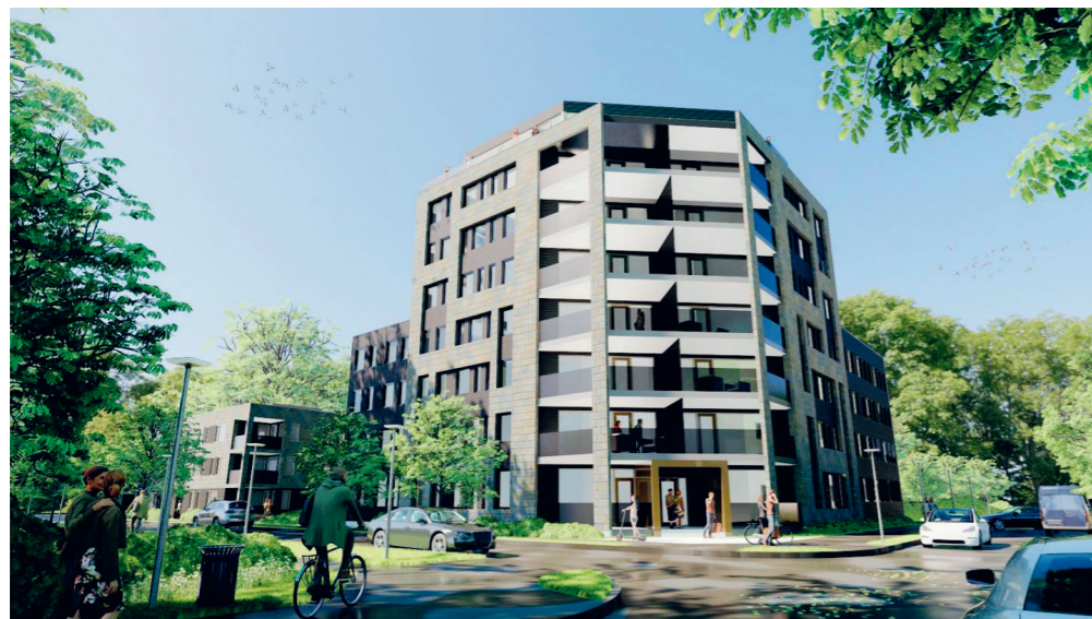
Etapp två planeras på Tornlyckan med 65 nya bostäder.

I Kvarteret Futurum ska det byggas ett sjuvåningshus i högsta miljöklass.