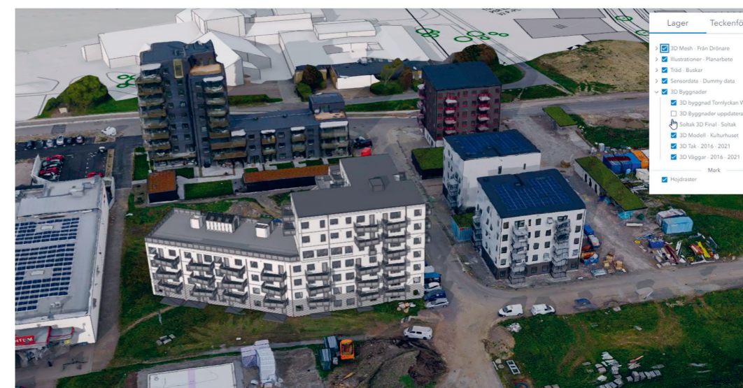
Här är ett klipp från en film som visar ny planerad bebyggelse på Tornlyckan tillsammans med befintlig i 3D.