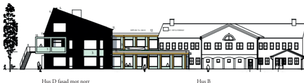
Hus D fasad mot norr