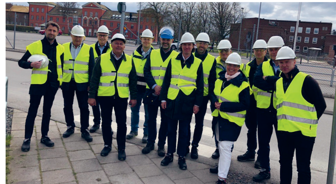
VD-nätverksträff på Höganäs AB i april.

Näringslivsavdelningen samlar två gånger varje år VD:arna för kommunens största företag. Syftet med träffarna är i första hand att skapa förutsättningar för nätverkande och erfarenhetsutbyte, men även att ge de största företagen en bra möjlighet att få ta del av vad som är på gång i kommunens arbete med företagsklimat. Ett av företagen står som värd för den aktuella träffen som avslutas med en rundvandring på företaget. Värd företag har bland andra varit Höganäs AB, Välinge Innovation, Nordic Waterproofing AB och Steglinge Gård.