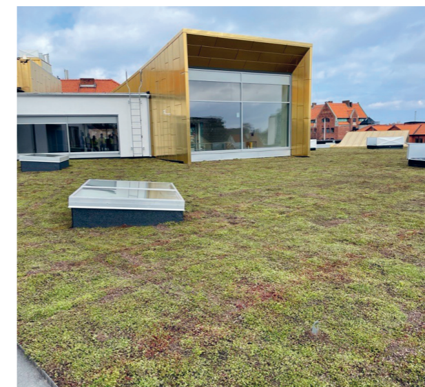
Bilder av det nya Kulturhuset. Till vänster: Sedumtaket och en av "utkikarna" som är klädd i bronsguld. Till höger: interiörbild från vårt nya Kulturhus.

Nytänk märks inte minst på husets tak. Ett grönskande sedumtak, ligger helt rätt i tid och är en