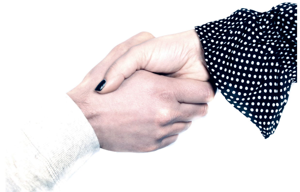
Två löneavtal har blivit klara i april i årets löneöversyn.