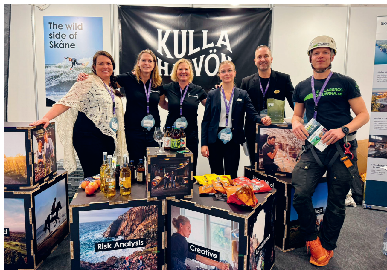
Exempel på hur vi jobbar med "A part of Kullahalvön". Här representerar Arilds vingård, Kullen tours, Rusthållargården, Villa Brunby och Kullabergsguiderna från Kullahalvön platsvarumärket på en mässa i Danmark.