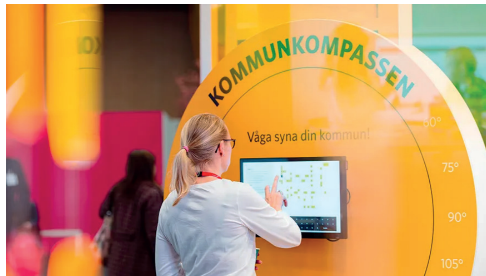
Den 13–14 februari genomför vi SKR:s Kommun-kompass för tredje gången.