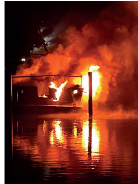
Brand på båt i Höganäs hamn.