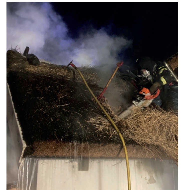
Det varit ett antal större bränder som orsakat stor skada för de enskilda, lyckligtvis inga dödsbränder då bränderna har upptäckts av de boende, brandvarnare och grannar.