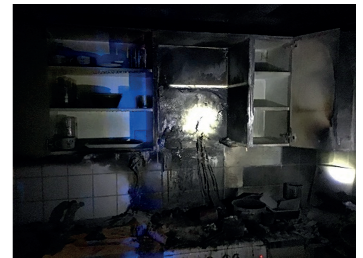
El-relaterade händelser är överrepresenterade tillsammans med de spisrelaterade bränder