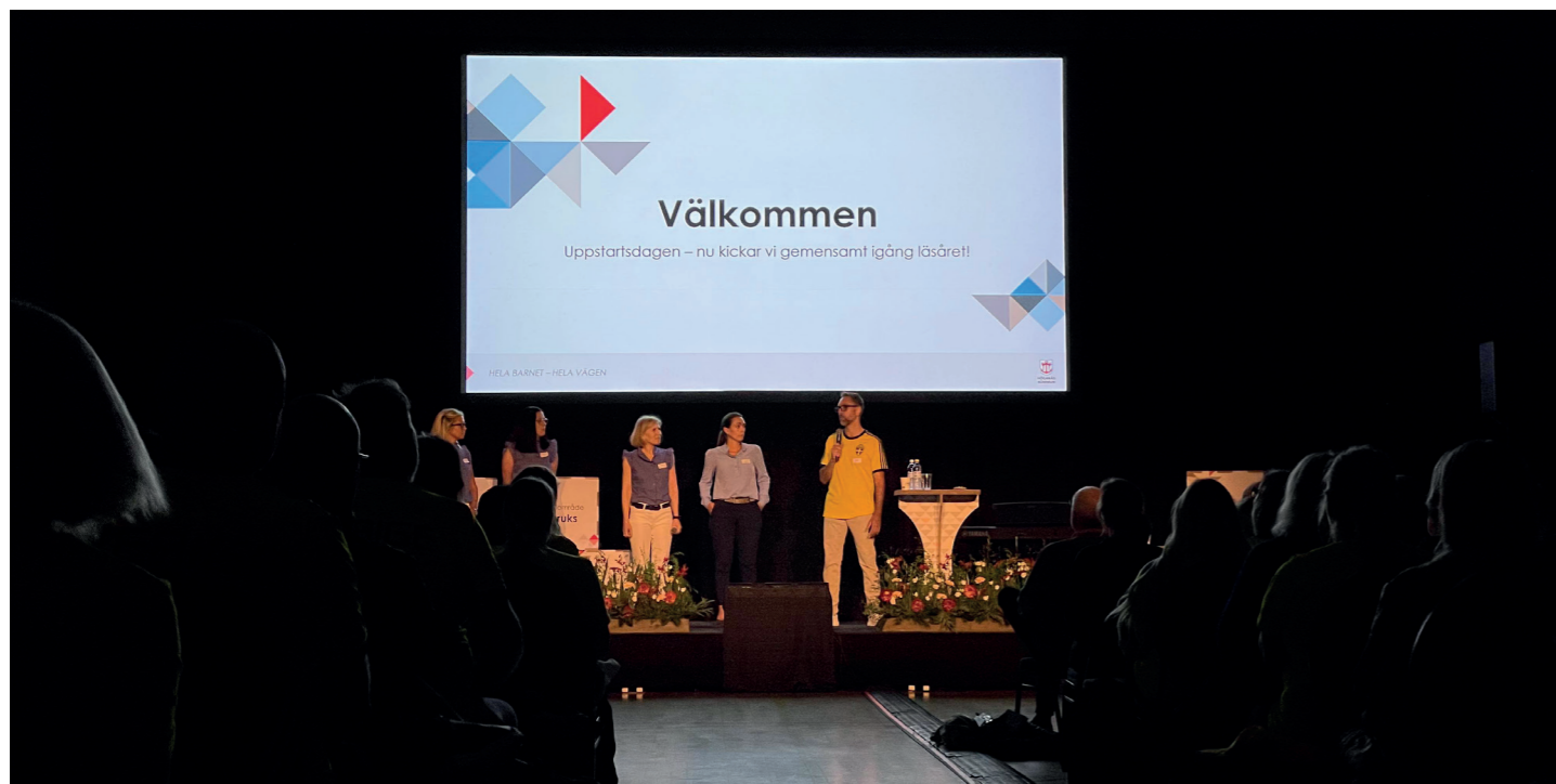
Vi klickar igång läsåret med upptastdagen.