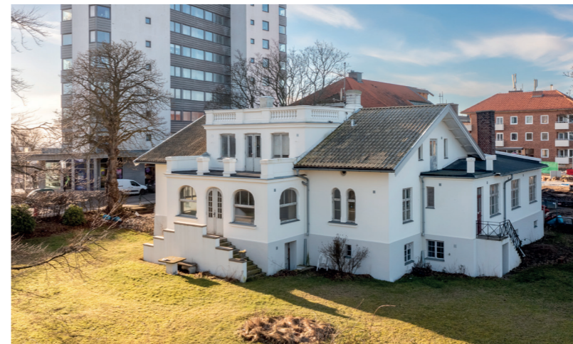
Väldigt många har tagit chansen att besöka Widdings villa i sommar för att ta del av berättelser och historik.