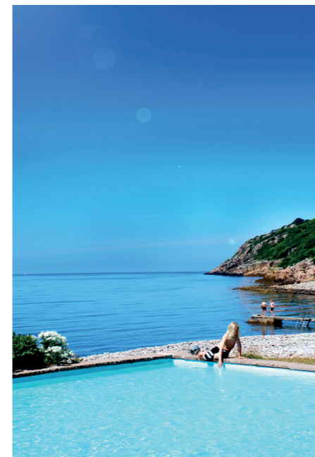
Bassängen i Mölle har utsatts för mycket vandalisering i sommar.