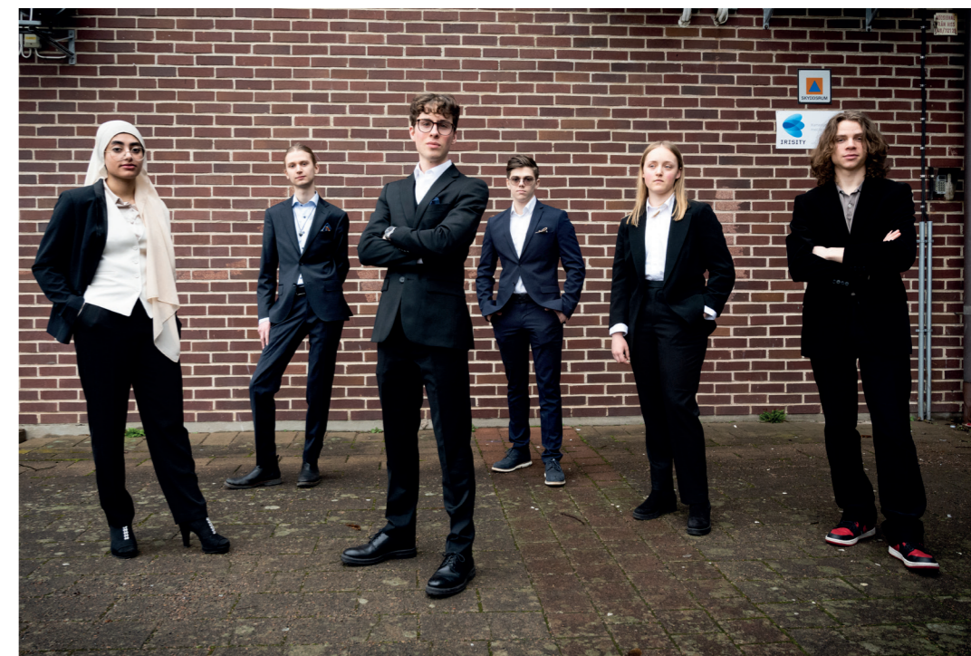
T4 eleverna från Kullagymnasiet som presenterade sina innovationer i Kullanäset.