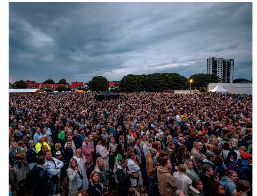
Årets mat- och sommarfest drog stor publik.