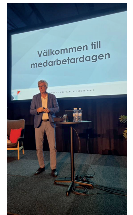
Ledar- och medarbetardagar har utvärderats för att kunna utvecklas framöver.