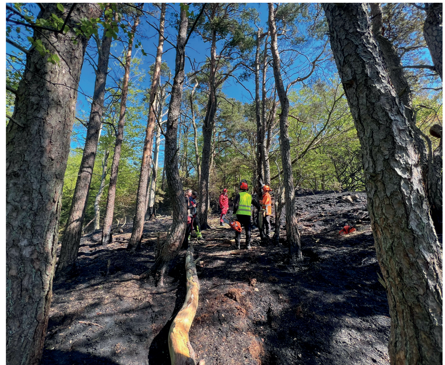
En av sommarens skogsbränder på Kullaberg. Branden hanterades bra utan större skador.