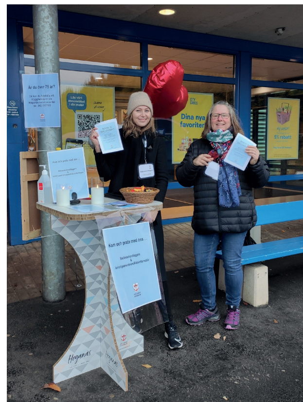
“Kom och prata med oss” Biståndshandläggare och anhörigsamordnare/äldreinformator informerar på olika platser.

I sina möten informerar de också om digitala möjligheter, som Medborgartjänsten för den som ansöker om hemtjänst och vill ha insyn i sitt ärende. Och En bra plats och Demenslotsen med information, rådgivning och erfarenhetsutbyte.