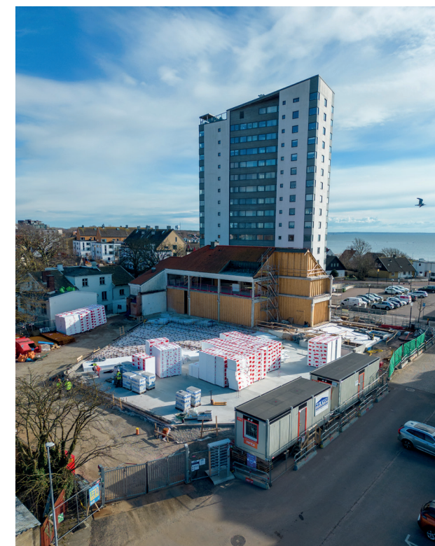
Pågående byggnation av kulturhus och Bruksskolan.

Förklaringen till det prognostiserade resultatet för helåret beror till största delen, förutom intäkter kopplade till exploateringsverksamheten, på ett fortsatt starkt skatteunderlag. Sedan budgeten för 2023 fastställdes har prognoserna för skatteunderlaget successivt stärkts. I den sammanlagda prognosen för finansförvaltningen förutsätts också att fullmäktiges reserver för oförutsedda behov inte nyttjas.