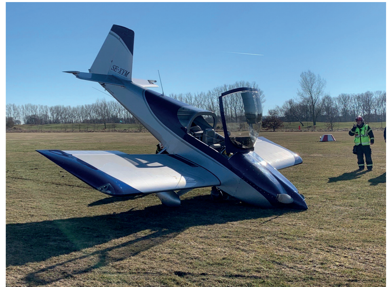
Flygolycka på flygfältet då ett noshjul vek sig vid landning.