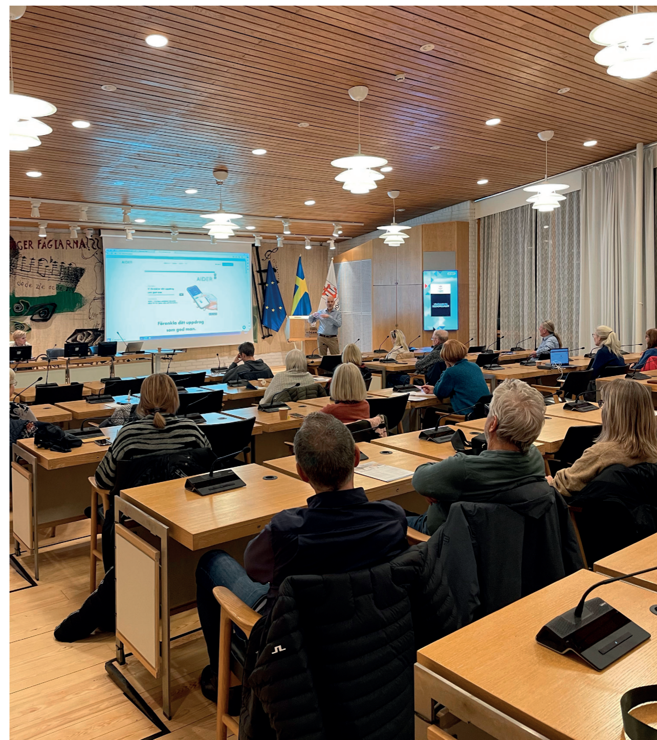
Aider berättar om den digitala redovisningstjänsten för våra gode män och förvaltare vid överförmyndarnämndens årliga träff den 16 oktober.