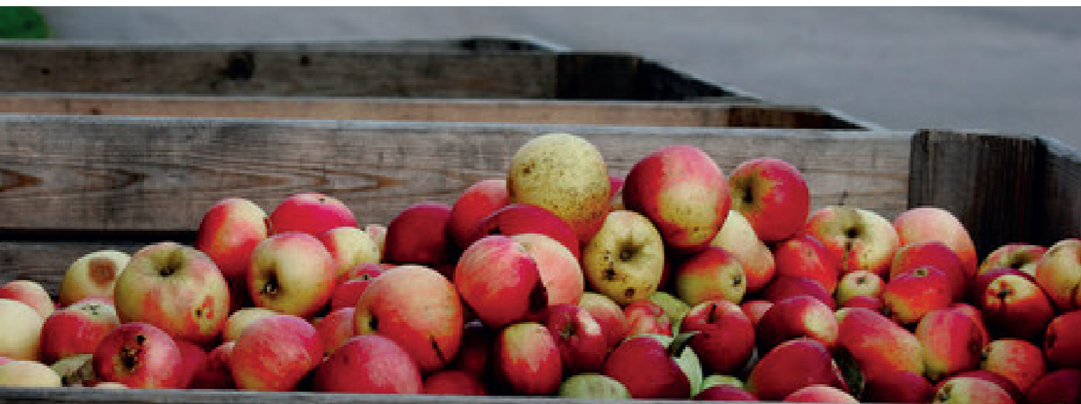
Överbliven frukt för att minska matsvinnet