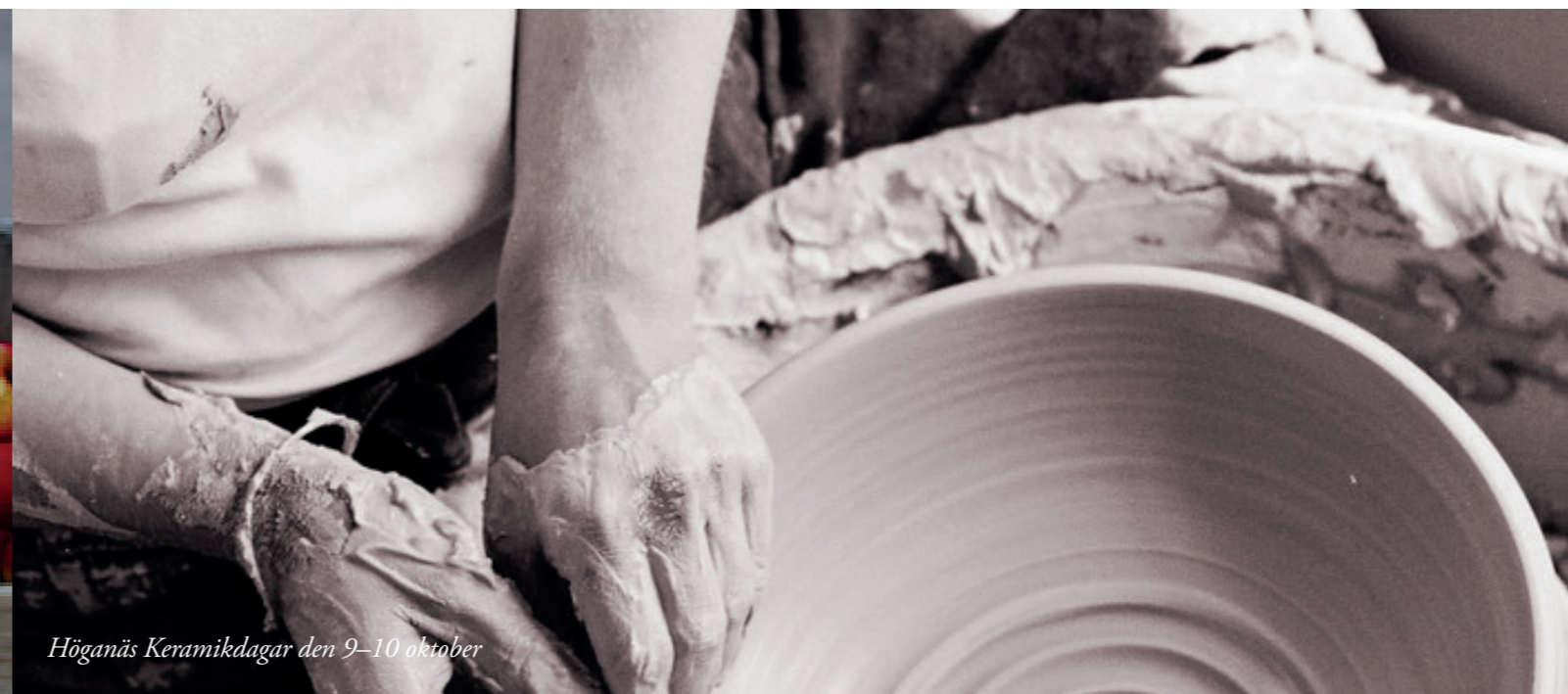
Höganäs Keramikdagar den 9–10 oktober